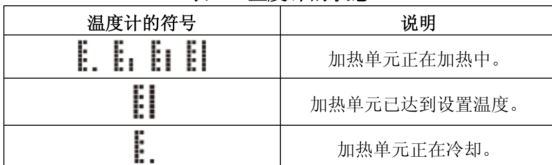
表 2 温度计的状态