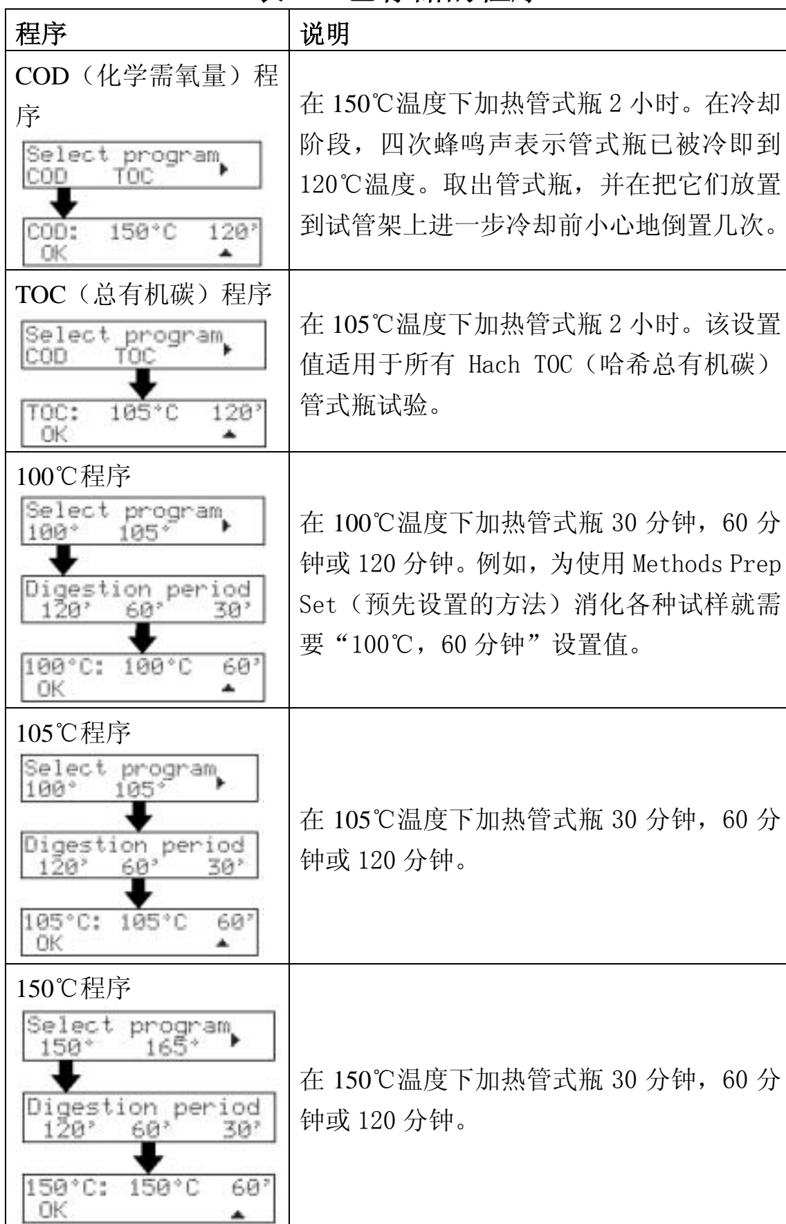
表 3 已存储的程序